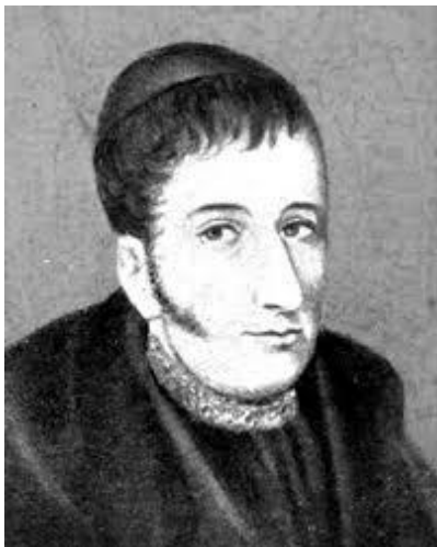
P. Dr. Antonio Sáenz Fundador de la Universidad de Buenos Aires

Firmada: Francisco de Laprida, Mariano Boedo, José M. Serrano, Juan J. Paso, Juan A. Maza. Dr. Antonio Sáenz (sacerdote), Fr. Cayetano Rodríguez (sacerdote), Dr. José E. Colombres (sacerdote), Dr. Pedro I de Castro Barros (sacerdote), Fr. Justo Santa María de Oro (sacerdote), Pedro F. de Ugarte (sacerdote), Pedro León Gallo (sacerdote), Dr. José I. Thames (sacerdote), Dr. Mariano Sánchez de Loria (sacerdote), José A. Pacheco de Melo (sacerdote), Dr. José Ignacio de Gorriti (sacerdote). (Sacerdote ausente por una misión diplomática junto a Artigas: Miguel del Corro ). Dr. Pedro M. Aráoz, Pedro I. Rivera, José S. Malabia, José Darragueira, Pedro Medrano, Esteban Gascón, Tomás M. de Anchorena, Manuel Acevedo, Jerónimo Salguero, José A. Cabrera, Eduardo Pérez Bulnes, Teodoro Sánchez de Bustamante, y Tomás Godoy Cruz. (29 firmantes entre ellos 11 sacerdotes, más del 35% del Congreso).+